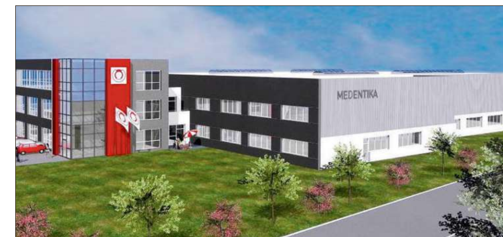
So soll die neue Halle einmal aussehen.