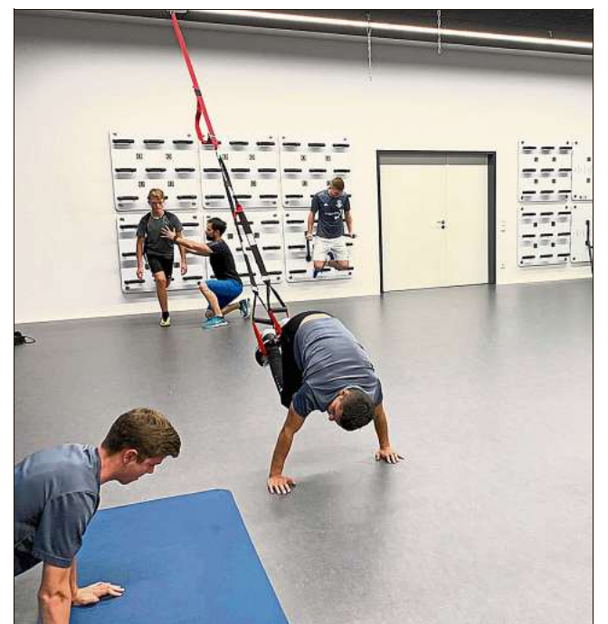
In den Kursräumen des TSV Sportzentrum können sich Teams aller Art auf die Saison vorbereiten.

Für weitere Informationen zum Saisonvorbereitungsangebot sowie zur Sandhas-Challenge aber auch zum Gesamtangebot des TSV Sportzentrum steht Alex mit seinem Team sowohl telefonisch unter 07051/80997700 als auch per eMail unter info@tsvsportzentrum.de zur Verfügung.