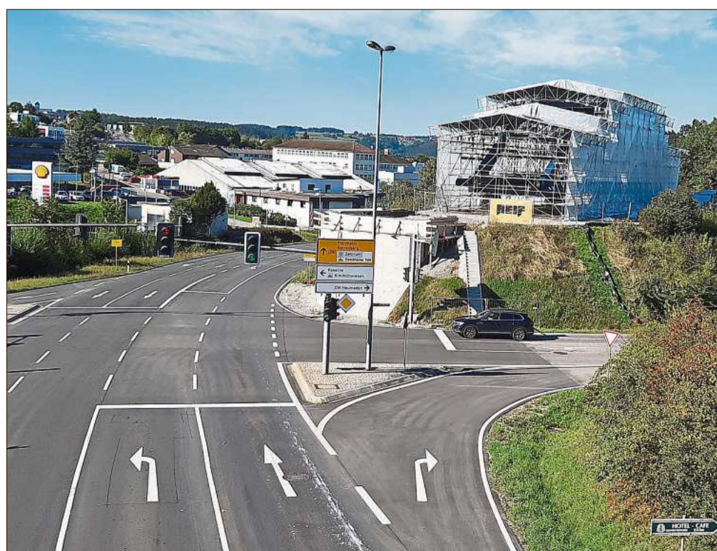
Die Bahnbrücke bei Heumaden wird momentan eingerüstet.

Lokalredaktion Calw Telefon: 07051/130816 Fax: 07051/130891 E-Mail: redaktioncalw@schwarzwaelder-bote.de Anfragen zur Zustellung: 0800/7807802 (gebührenfrei)