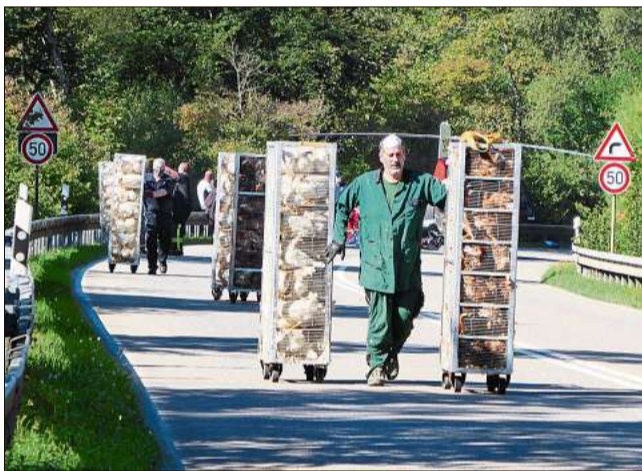
Dutzende lebendige Hühner mussten aus dem Tiertransporter in einen anderen Transporter umgeladen werden.

Calw. Die Bundesstraße ist voller Federn, in den Fahrzeugtrümmern liegt ein Sonnenhut, ein Rettungshubschrauber steigt auf. Es ist ein erschreckendes Bild, das sich den Rettungskräften in der Kurve zwischen Calwer Ortsausgang und der Abzweigung Richtung Öländerle bietet. Direkt nach dem Fahrbahnteiler war am Freitagmorgen gegen 8.15 Uhr eine 34-jährige Autofahrerin aus bisher noch ungeklärter Ursache auf die Gegenseite gekommen und dort in einen Lastwagen gekracht, der Dutzende lebende Hühner transportierte. Die Fahrerin wurde dabei in ihrem Fahrzeug eingeklemmt und musste von der Calwer Feuerwehr freigeschnitten werden. Sie wurde mit dem