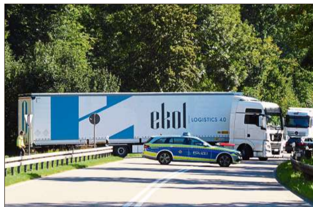
Fast fünf Stunden lang war die B 463 gesperrt. Das sorgte für ein Verkehrschaos, Lastwagen mussten wenden.

nen und stellten sich demonstrativ davor.