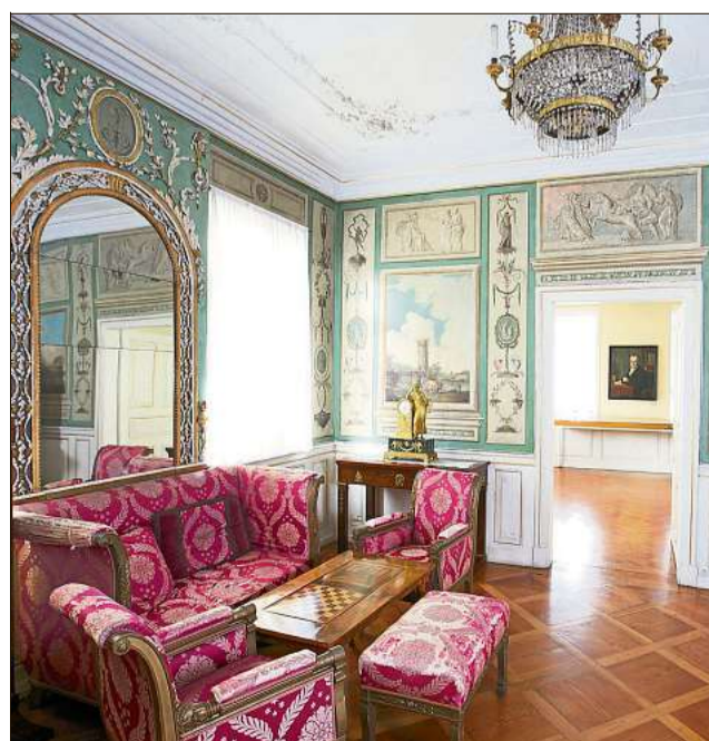
Im Palais Vischer wird die gehobene Wohnkultur des 18. Jahrhunderts gezeigt.

In allen Museen ist während des gesamten Besuches eine Mund-Nasen-Bedeckung zu tragen und auf die Einhaltung des Mindestabstandes zu achten.